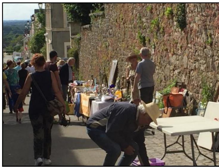
Dimanche 4 juin: « Les Puces suzannaises » dans les rues de la Cité et Place Hubert II