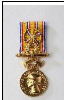
Médaille d'or Pour 35 années De service