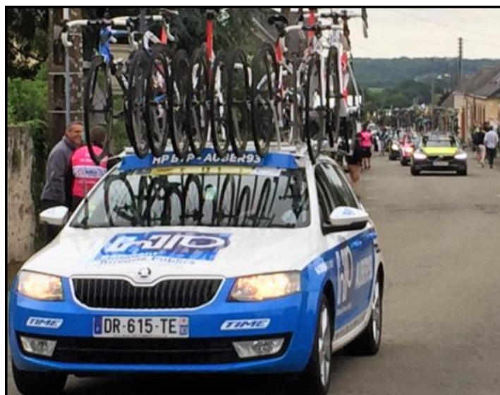
Samedi 3 juin: passage à Sainte-Suzanne de la course cycliste « Les Boucles de la Mayenne »