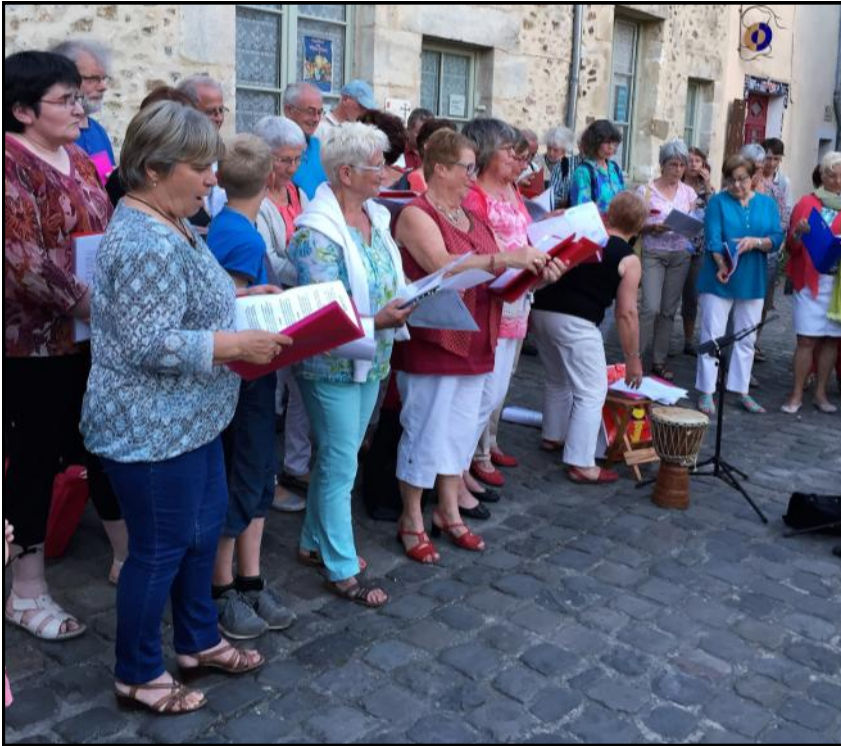
Le Chœur de la Cité