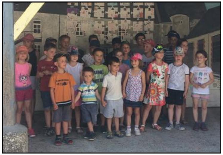
Les enfants ont chanté « On écrit sur les murs » après avoir montré aux parents les photos de leur voyage à l'île d'Yeu.