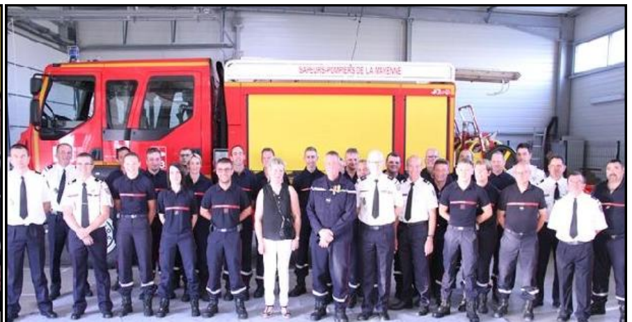
L'ensemble des personnes présentes à la cérémonie