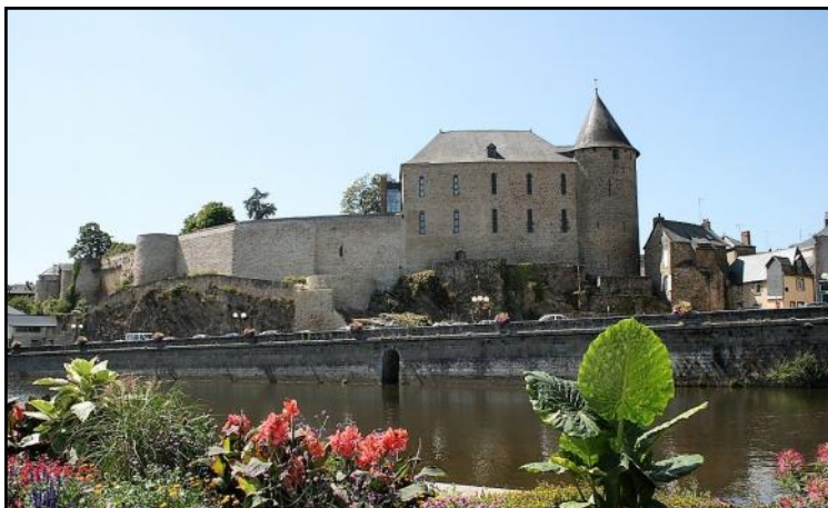
Fontaine-Daniel, berceau des « Toiles de Mayenne »

Renseignements auprès du secrétariat de mairie au 02 43 01 40 10.