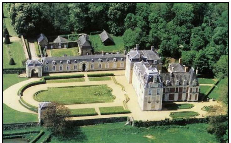
Saint-Sulpice - château de la Rongère