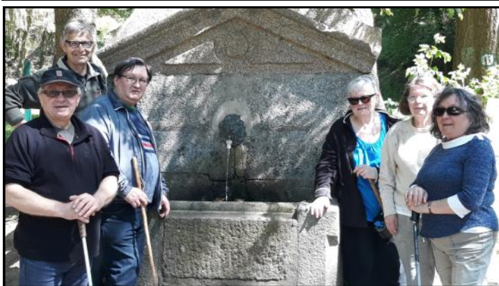
Les randonneurs de la section randonnée pédestre des Francs-Tireurs Suzannais lors de leur arrivée à la fontaine du bois du Tay le mercredi 15 juin