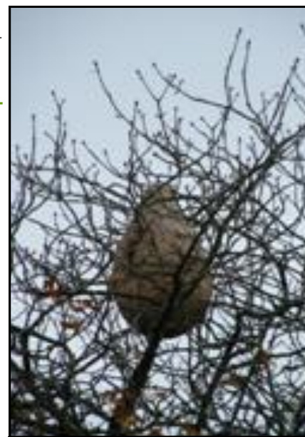
Nid de frelon asiatique